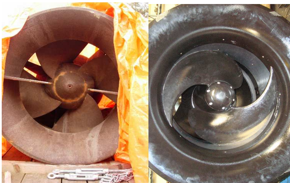
figuur 2.1 Conventionele waaier vorm (links) en waaier vorm van FFI (rechts)

Het principe van de axiaalpomp van FishFlow Innovations en Nijhuis Pompen berust op een aanpassing van de vorm van zowel de rotor als de leischoepen. De vormgeving van de visveilige waaier is afgeleid van de buisvizel van FishFlow Innovations (zie § 2.2) en berust daarmee op dezelfde principes. Opvallend is dat de waaier een grotere kogeldoorlaat heeft dan een conventionele waaier. Dit wil zeggen dat er meer ruimte tussen de diverse rotorbladen is om voorwerpen te laten passeren. De waaier vorm stuurt water (en vis) door het midden van de waaier en weg van de wanden. Daarnaast zijn de randen van de waaier en leischoepen afgerond om sneden tegen te gaan. In figuur 2.1 zijn de conventionele en visvriendelijke waaier vorm weergegeven.