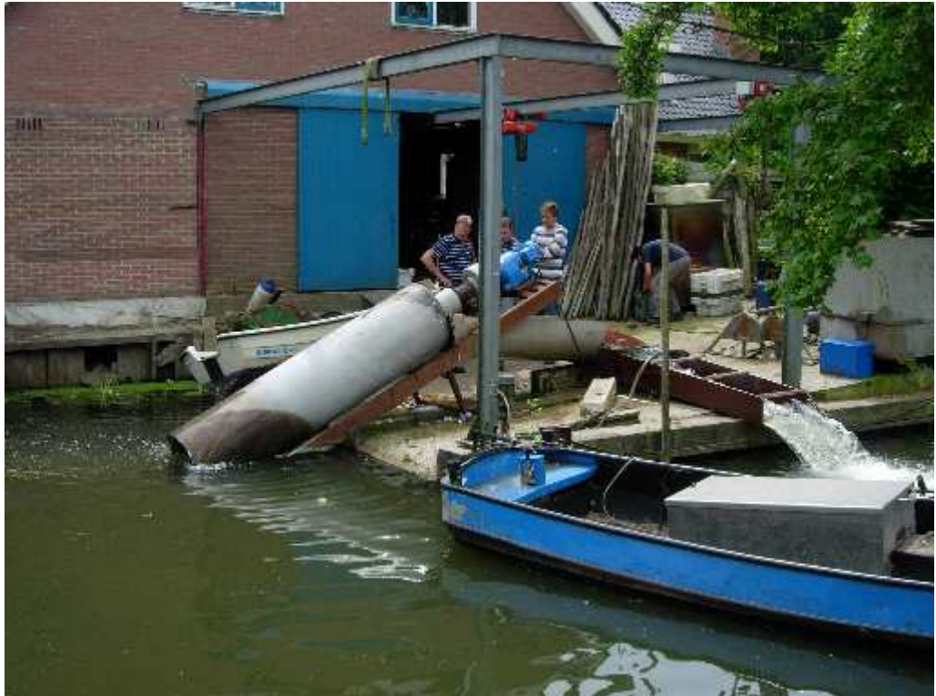
figuur 3.4 Testopstelling met buisvizel