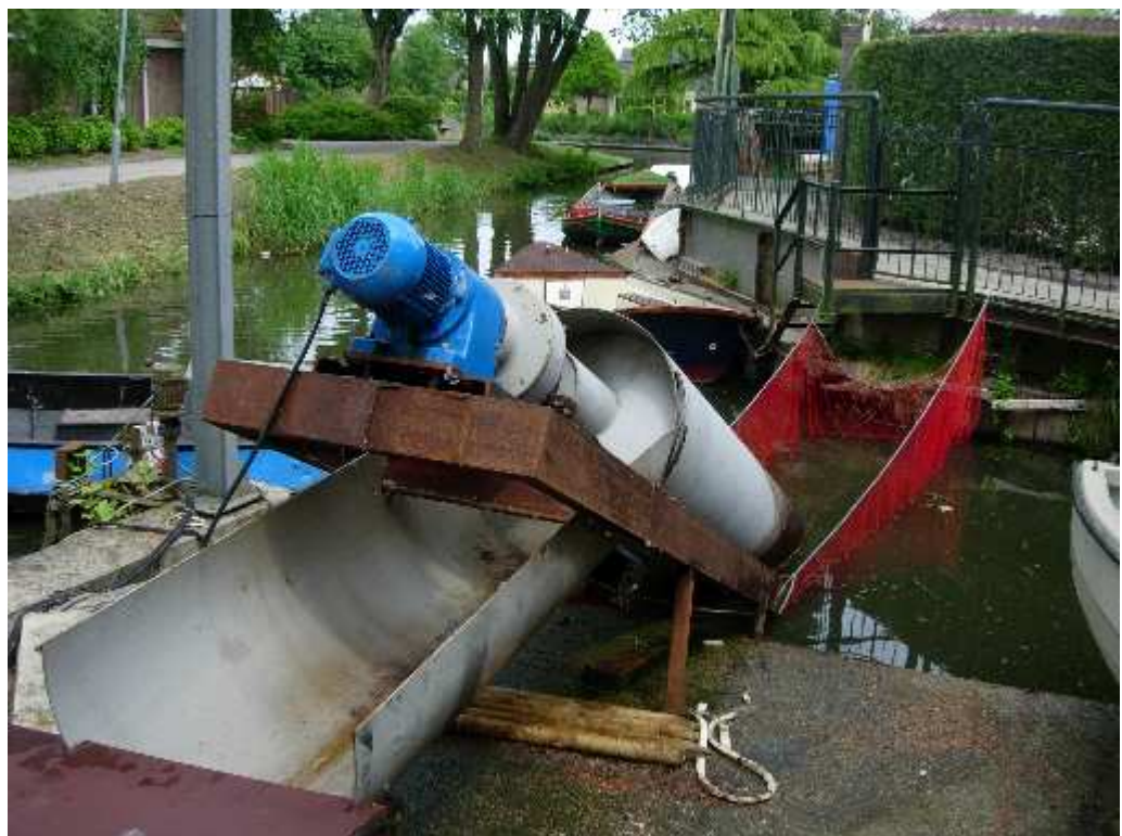
figuur 3.5 Netconstructie voor aanvoer van vissen naar de buisvizel