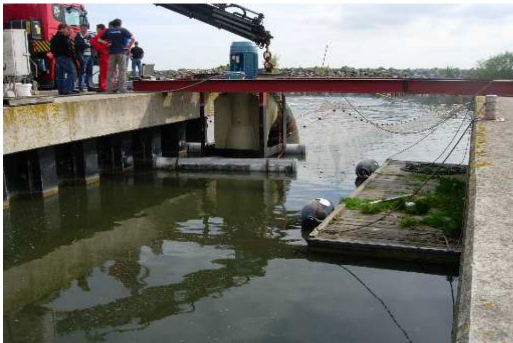
figuur 3.3 Aanzicht van de pomp in de kooi

Voor aanvang van de eigenlijke proef werd proefgedraaid met de pomp zonder dat er vissen in de aanvoerkooi aanwezig waren. Hierbij werd een grote hoeveelheid slib opgewerveld, waaruit kon worden afgeleid dat het onder de uitstroomopening van de pomp relatief ondiep was. Door de waterstraal werd lokaal slib weggeblazen, zodat de condities voor de uitvoering van de proef verbeterden.