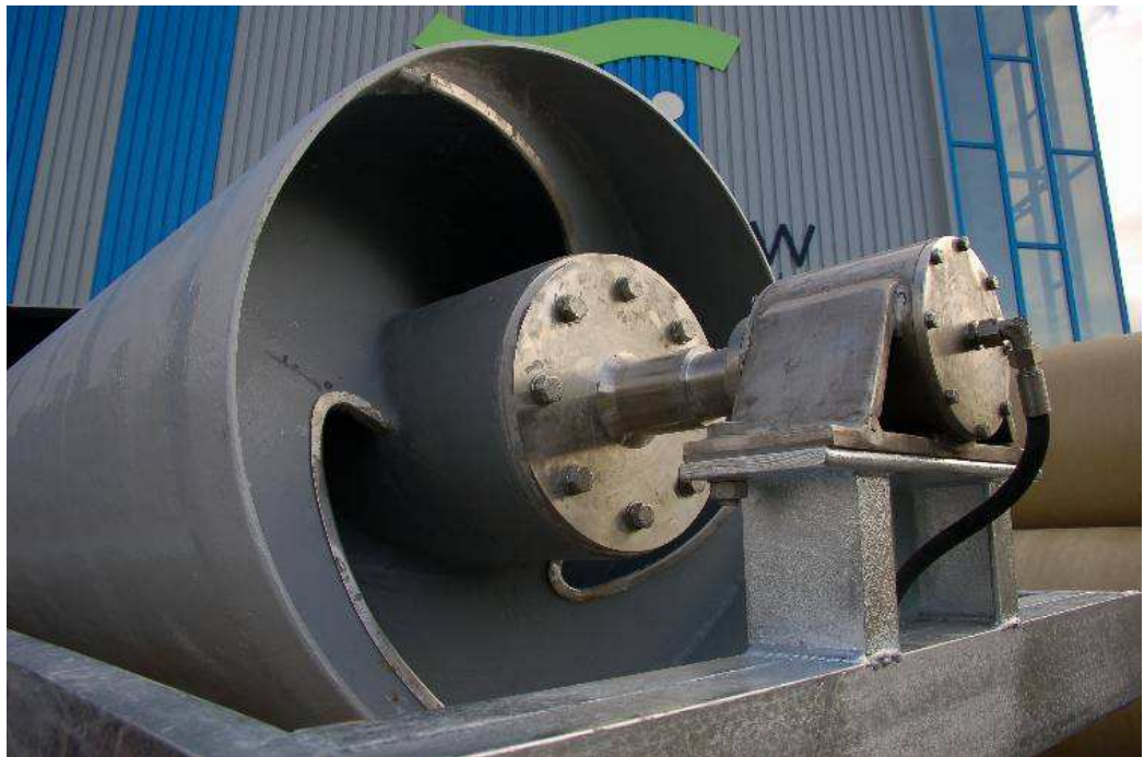
figuur 2.3 Buisvijzel van FishFlow Innovations

uiteinden van de vijzel geleidelijk af. Daardoor lopen de bladen terug naar de buitenkant van de vijzel tot ze uiteindelijk op lijken te gaan in de buis rond de vijzel. In figuur 2.3 wordt de buisvijzel van FishFlow Innovations weergegeven.