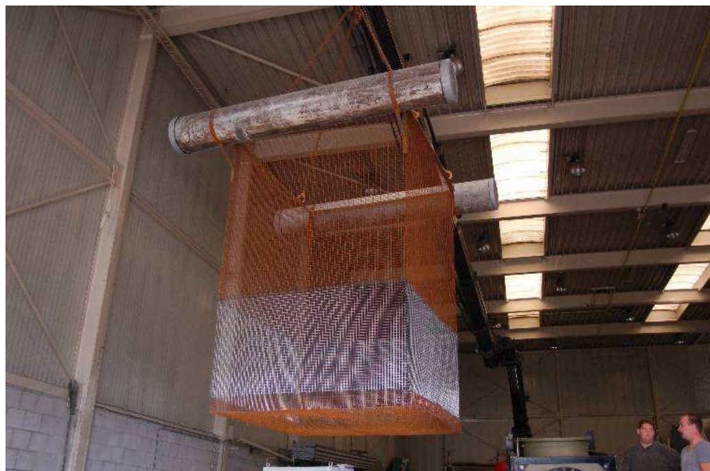
figuur 3.2 Kooi voor de aanvoer van vissen