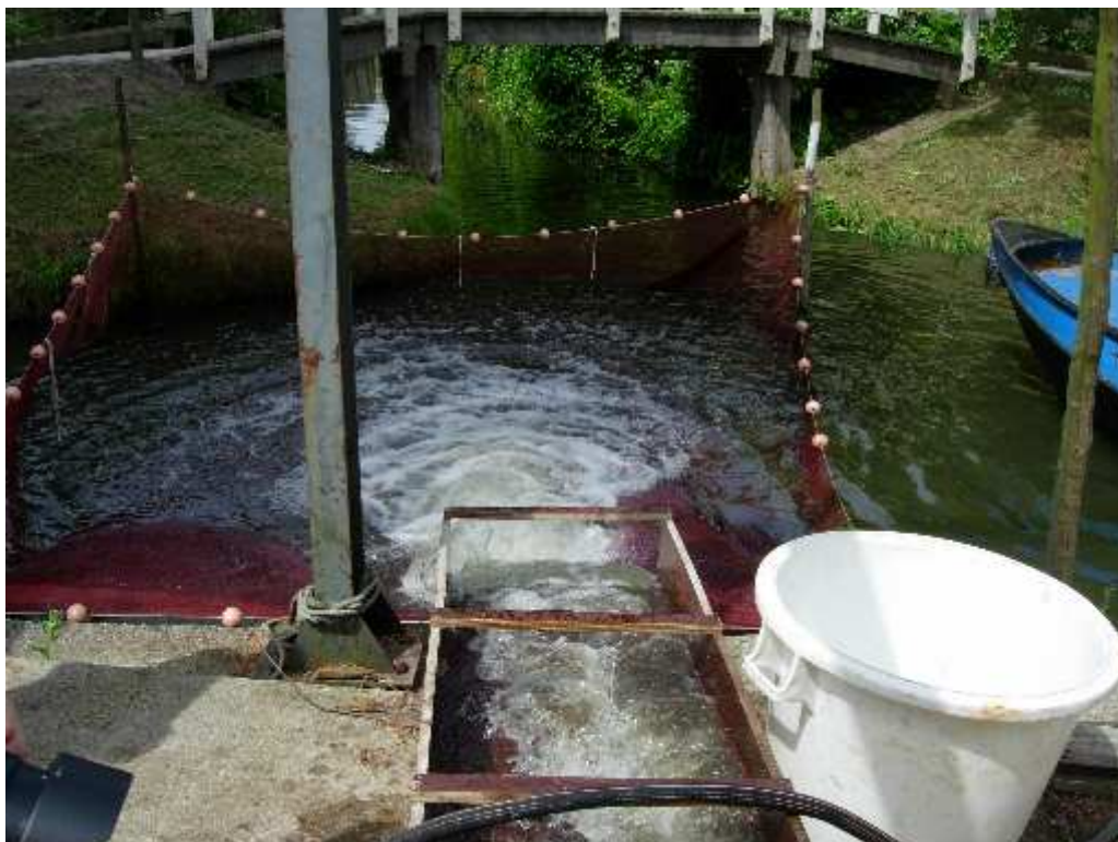
figuur 3.6 Netconstructie voor opvang van uitgemalen vissen