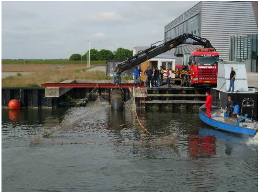
figuur 3.1 Axiaalpompe in de testopstelling

zoveel mogelijk te voorkomen. Figuur 3.1 geeft een beeld van de axiaalpompe in de testopstelling. Figuur 3.2 laat de kooi voor aanvoer van de vis zien. Figuur 3.3 geeft het aanzicht van de axiaalpompe in de aanvoerkooi.