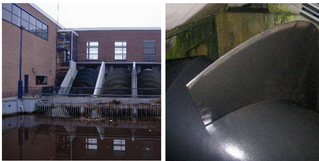
figuur 2.2 Voorbeeld van een conventioneel vijzelgemaal met rechts detail van de winding

De meeste Nederlandse vijzelpompen zijn uitgevoerd als open vijzels. Hierbij draait de vijzel in een betonnen of metalen goot, de opleider. Hoewel de vijzel voor een optimaal rendement zoveel mogelijk op de opleider moet aansluiten, is er altijd sprake van water dat tussen de vijzel en de opleider terugloopt. Vissen lopen het risico om beschadigd te raken door in de spleet tussen de vijzel en de opleider beklemd te raken. In figuur 2.2 wordt een conventioneel vijzelgemaal weergegeven evenals een detail van het begin van een winding.